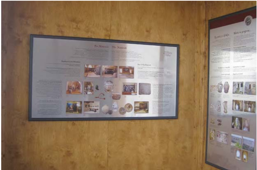
Εικ. 13: Κάστρο Χλεμούτσι. Σταθμός πληροφόρησης (infokiosk).

ξύλινη διαδρομή θέασης (εικ. 12), η οποία κατασκευάστηκε στο επίπεδο του κατεστραμμένου μεσοπατώματος, ούτως ώστε οι επισκέπτες να έχουν τη δυνατότητα να παρατηρούν από μικρή απόσταση τα σημαντικά ευρήματα που ήρθαν στο φως από τις εργασίες αποκατάστασης, όπως τις τοιχογραφίες του πριγκιπικού παρεκκλησιού και τα αναστηλωμένα παράθυρα του Κάστρου. Για τη διευκόλυνση της πρόσβασης και παραμονής των επισκεπτών στον αρχαιολογικό χώρο δημιουργήθηκε χώρος στάθμευσης και διαμορφώθηκε διαδρομή πρόσβασης ΑμεΑ. Η κατασκευή infokiosk (εικ. 13) με πληροφοριακή υποδομή (εικ. 14) για την ιστορία, τα στοιχεία αρχιτεκτονικής του κάστρου, τα ευρήματα από τις ανασκαφικές εργασίες και την περιγραφή του έργου αποκατάστασης των αιθουσών, σε συνδυασμό με τη δημιουργία εποπτικού υλικού, στο οποίο περιλαμβάνονται βιντεοπροβολή, δίγλωσσες ενημερωτικές πινακίδες και έντυπα συμβατικά και σε γραφή Braille, είναι στοιχεία που προσφέρουν στον επισκέπτη μια ολοκληρωμένη εικόνα του κάστρου και των εργασιών που υλοποιήθηκαν σε αυτό.