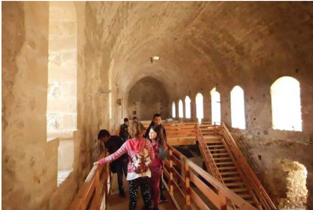
Εικ. 12: Κάστρο Χλεμούτσι. Εκπαιδευτικό πρόγραμμα στην ειδικά διαμορφωμένη με διαδρομή θέασης αίθουσα Α1.

παρεκκλήσι λατινικού δόγματος. Το Κάστρο Χλεμούτσι αποτελεί τοπόσημο και τον πυρήνα του ομώνυμου οικισμού που το περιβάλλει. Συνδέεται με τη συλλογική μνήμη των κατοίκων, ενώ διαμορφώνει την πολιτιστική τους ταυτότητα.