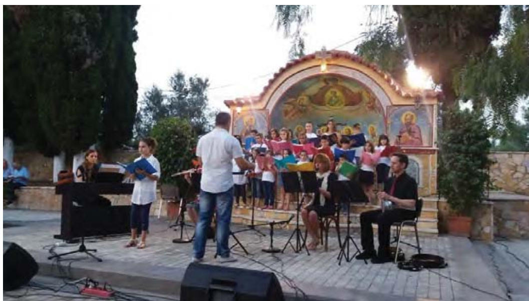
Εικ. 5: Καθολικό Ι. Μ. Φραγκαβίλλας. Μουσική εκδήλωση στον αύλειο χώρο.

Εξετάζεται μαζί με τα εκκλησιαστικά μνημεία, σύμφωνα με την αρχική του χρήση και λειτουργία, παρότι σήμερα εντάσσεται στους αρχαιολογικούς χώρους. Μετά την ίδρυση του φράγκικου Πριγκιπάτου του Μωριά, κατά το α΄ μισό του 13ου αι. το Τάγμα των Δομινικανών μοναχών ίδρυσε την Αγία Σοφία, η οποία λειτούργησε ως καθεδρικός ναός και έδρα του λατίνου επισκόπου Ωλένης (Kitsiki-Panagoroulos 1979: 64-77; Cooper 1996; Coulson 1996; Athanasiou 2013: 113-115). Ήταν μια μεγάλων διαστάσεων τρίκλιτη βασιλική