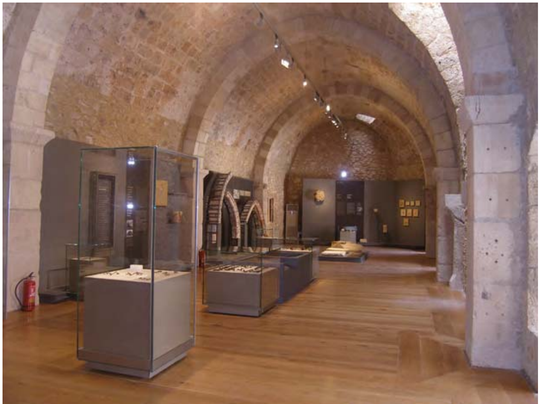
Εικ. 17: Κάστρο Χλεμούτσι. Μουσειακός χώρος.

Στο πλαίσιο της διαχειριστικής πολιτικής και της προβολής του μουσείου, εκθέματά του μεταφέρθηκαν και παρουσιάστηκαν στην έκθεση «Σταυροφορίες. Μύθος και Πραγματικότητα. Crusades. Myth and Realities» (Τουμαζής κ.ά. 2005: 68-69 αρ. 2, 180-181 αρ. 79, 186-187 αρ. 85, 202-203 αρ. 92, 203 αρ. 93, 204-205 αρ. 94), η οποία διοργανώθηκε την περίοδο 2004-2006 διαδοχικά σε τέσσερις χώρες: Κύπρος (Δημοτικό Κέντρο Τεχνών Λευκωσίας, σε συνεργασία με το Ίδρυμα Πιερίδη), Ελλάδα (Ίδρυμα Μείζονος Ελληνισμού), Ιταλία (Istituto per le Tecnologie Applicate ai Beni Culturali, Old Arsenal-Amalfi) και Μάλτα (Sovrintendenza Tal-Patrimonju kulturali). Έγινε δανεισμός επίσης ενός εμβληματικού εκθέματος 6 στο πλαίσιο της έκθεσης «Heaven and Earth: Art of Byzantium from Greek Collections», (2013-2014) που πραγματοποιήθηκε στις ΗΠΑ (National Gallery of Art στην Ουάσινγκτον και J. F. Getty Museum στο Λος Άντζελες) (Drandaki κ.ά. 2013: 312-313).