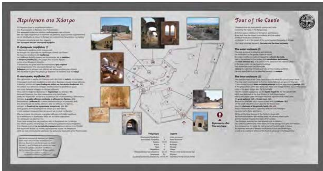
Εικ. 14: Κάστρο Χλεμούτσι. Πινακίδα περιήγησης.

Ηλείας. Μέσω των επεξηγηματικών πινακίδων, των εντύπων, της επαφής των επισκεπτών με τα εκθέματα του μουσείου, των πωλητέων ειδών, της επικοινωνίας με την υλοποίηση εκπαιδευτικών προγραμμάτων, 4 αλλά και με την παραχώρησή του για πραγματοποίηση μουσικοθεατρικών παραστάσεων και άλλων δρώμενων (εικ. 15, 16), 5 το Κάστρο Χλεμούτσι, με συνεχώς αυξανόμενη επισκεψιμότητα, διαμορφώνεται σε ένα πολυδιάστατο επικοινωνιακό οργανισμό, μια μονάδα πολιτιστική με πολλές δυνατότητες που μπορεί να συμβάλει θετικά στην τουριστική, κοινωνική και οικονομική ανάπτυξη της περιοχής.