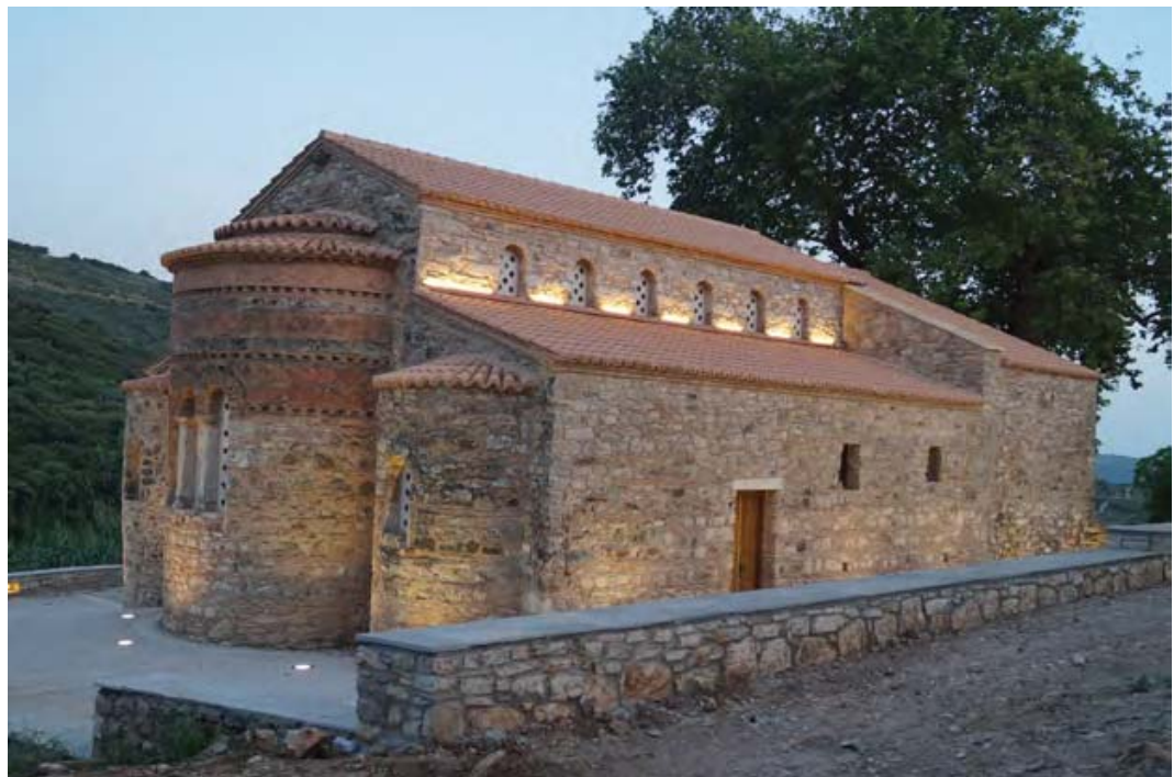
Εικ. 2: Κοίμηση Θεοτόκου Ζούρτσας. Το μνημείο μετά τις εργασίες στερέωσης, αποκατάστασης και διαμόρφωσης του αύλειου χώρου.

Κινητά ευρήματα από τις ανασκαφές στο μνημείο προβλέπεται να εκτεθούν, μετά τη σύνταξη μουσειογραφικής μελέτης, σε ειδικά διαμορφωμένη αίθουσα στο Λαογραφικό Μουσείο του οικισμού. Με τον τρόπο αυτό οι διαφορετικές ομάδες επισκεπτών θα έχουν τη δυνατότητα να δουν τεκμήρια του υλικού πολιτισμού προγενέστερων περιόδων που συνδέονται τόσο με τις οικοδομικές φάσεις του μνημείου (από την ίδρυσή του μέχρι τις αρχές του 20ου αι.), όσο και με την ιστορία του οικισμού της Ζούρτσας και των κατοίκων της.