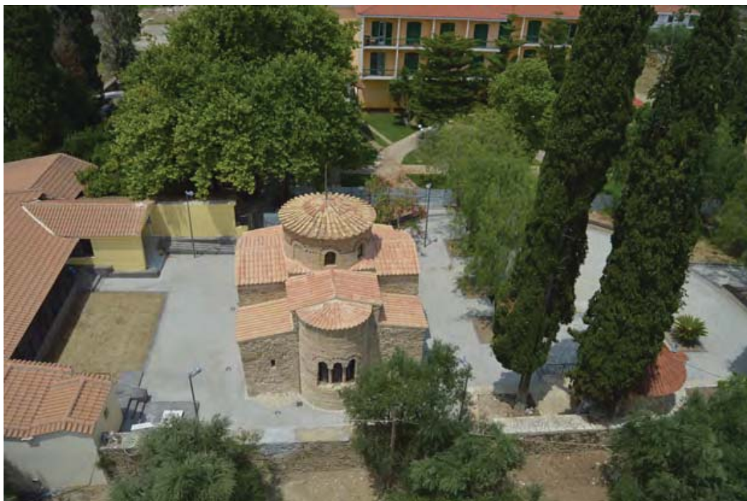
Εικ. 4: Καθολικό Ι. Μ. Φραγκαβίλλας μετά τις εργασίες αποκατάστασης και διαμόρφωσης του περιβάλλοντα χώρου.

Οι επεμβάσεις που υπέστη ο ναός ανά τους αιώνες αλλοίωσαν τη μορφή του και επιδείνωσαν τη στατική του επάρκεια. Στερεωτικές εργασίες στο μνημείο πραγματοποιήθηκαν από την Εφορεία αρχικά στο πλαίσιο του Γ' ΚΠΣ. Η «Ολοκλήρωση στερέωσης και αποκατάστασης Καθολικού Ιεράς Μονής Φραγκαβίλλας, Αμαλιάδας Ηλείας» (εικ. 4) πραγματοποιήθηκε στο πλαίσιο του ΕΣΠΑ (Κουμούση 2016: 34-35). Το έργο είχε συνολική δαπάνη 648.000,00 ευρώ. Εκτός των εργασιών στερέωσης και αποκατάστασης του ναού, εκτελέστηκαν εκτεταμένες εργασίες διαμόρφωσης του περιβάλλοντα χώρου (πλακοστρώσεις, κατασκευή καθιστικών, εξωραϊσμός εντευκτηρίου και υπαίθριου χώρου τέλεσης μυστηρίων, πρόσβαση ΑμεΑ, φωτισμός ανάδειξης του μνημείου και λειτουργικός