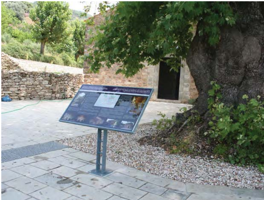
Εικ. 3: Κοίμηση Θεοτόκου Ζούρτσας. Ενημερωτική δίγλωσση πινακίδα στον αύλειο χώρο του ναού.

Η διοργάνωση εκπαιδευτικών προγραμμάτων από ειδικό επιστημονικό προσωπικό μπορεί να συμβάλλει στην κοινωνικοποίηση του μνημείου. Μέσω σχετικών δράσεων, ένα μνημείο σε μια απομακρυσμένη περιοχή δύναται να αποτελέσει μέρος της καθημερινότητας της τοπικής κοινωνίας στη σύγχρονη πραγματικότητα και να προστατευτεί καλύτερα. Στην κατεύθυνση αυτή συνέβαλαν η επίσκεψη στις 02-04-2017 του "Let' s do it Greece", της συντονιστικής επιτροπής της πανελλαδικής εκστρατείας Δράσεων Εθελοντισμού, η πραγματοποίηση στον περιβάλλοντα χώρο του μνημείου εκδήλωσης προς τιμήν του ζουρτσάνου μουσικολόγου Σίμωνα Καρρά στις 18 & 19-08-2017, οι βιβλιοπαρουσιάσεις, οι ομιλίες για πολιτιστικά θέματα της ευρύτερης περιοχής, καθώς και οι επισκέψεις μαθητικών ομάδων καθόλη τη διάρκεια του χρόνου.