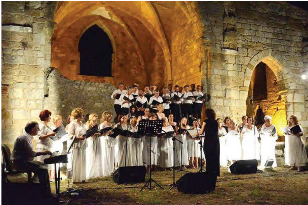
Εικ. 7: Αρχαιολογικός χώρος Αγίας Σοφίας Ανδραβίδας. Μουσική εκδήλωση.