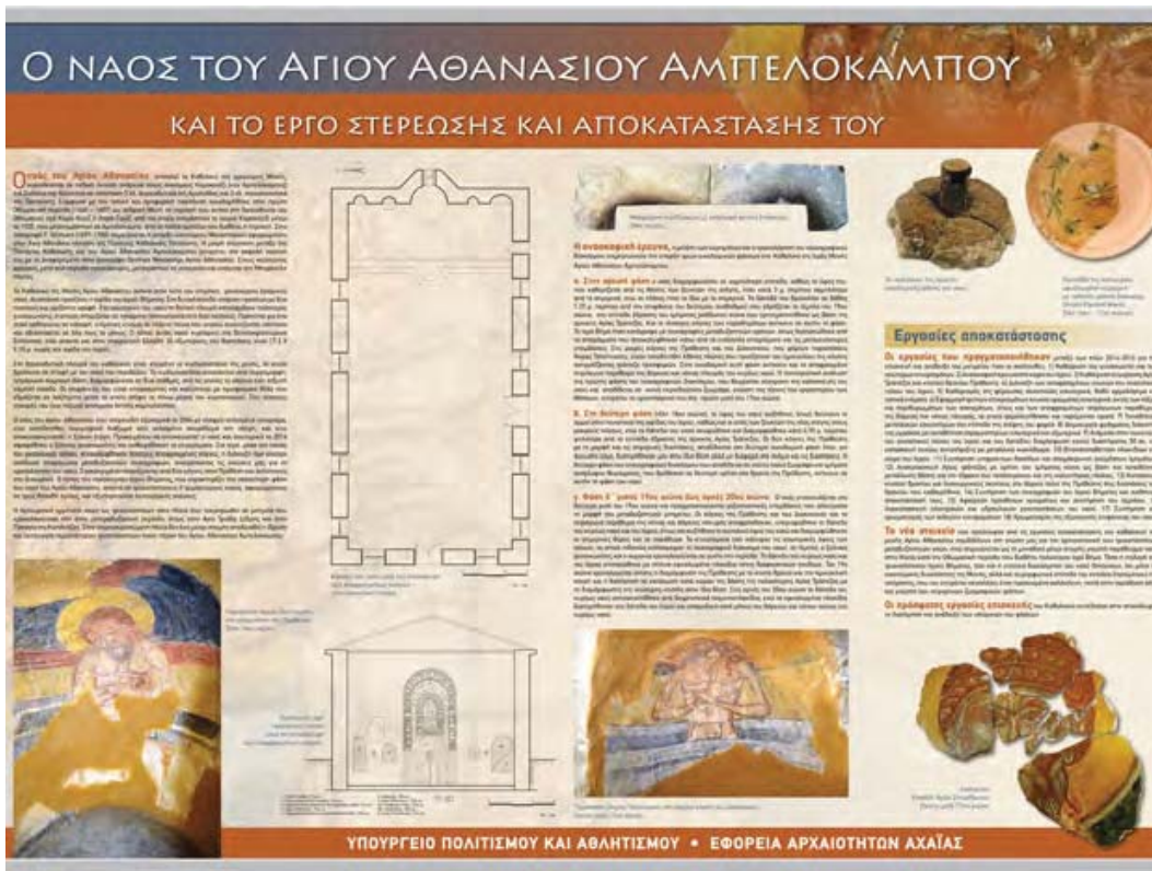
Εικ. 10: Ι. Μ. Αγίου Αθανασίου Αμπελόκαμπου. Πινακίδα ενημέρωσης στον αύλειο χώρο.

περιοχής, το εγκαινίο που είχε τοποθετηθεί στη βάση της αρχικής Αγίας Τράπεζας, η οποία αποκαλύφθηκε κατά τη διάρκεια της ανασκαφικής έρευνας κάτω από το σύγχρονο δάπεδο, μεταφέρθηκε και επανατοποθετήθηκε στη διάρκεια ειδικής τελετής.