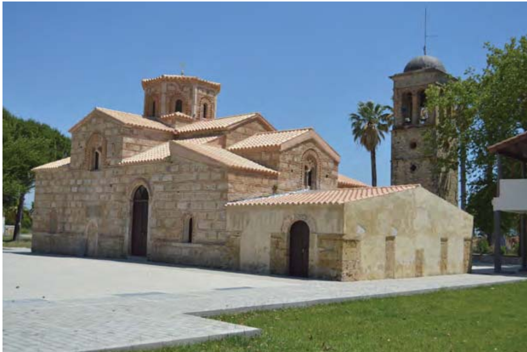
Εικ. 8: Παναγία Καθολική Γαστούνης μετά τις εργασίες αποκατάστασης.