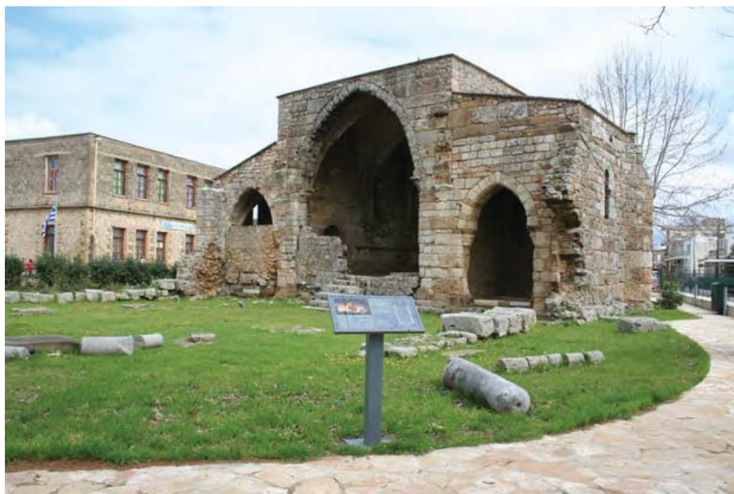
Εικ. 6: Αρχαιολογικός χώρος Αγίας Σοφίας Ανδραβίδας μετά τις εργασίες ανάδειξης.

Το 2013 υλοποιήθηκε το έργο «Διαμόρφωση αρχαιολογικού χώρου Αγίας Σοφίας Ανδραβίδας» βάσει εγκεκριμένης μελέτης που είχε εκπονηθεί από την Εφορεία και αποσκοπούσε στην ανάδειξη του φράγκικου μνημείου με ήπιες επεμβάσεις (εικ. 6) (Κουμούση 2013). Η συνολική δαπάνη του έργου ανήλθε στις 87.900,00 ευρώ. Η αναβάθμιση του αρχαιολογικού χώρου διευκολύνει πλέον την επισκεψιμότητά του και παράλληλα έχει δημιουργήσει ένα σημαντικό πολιτισμικό πυρήνα στην πόλη. Η πραγματοποίηση εκπαιδευτικών προγραμμάτων και η παραχώρηση του αρχαιολογικού χώρου για τη διοργάνωση ποικίλων καλλιτεχνικών εκδηλώσεων (εικ. 7) φέρνει σε επαφή το κοινό με το μυσταγωγικό περιβάλλον του μνημείου και το καθιστά κοινόν του πολιτισμού και της τέχνης την περίοδο της φράγκικης κατάκτησης της Πελοποννήσου.