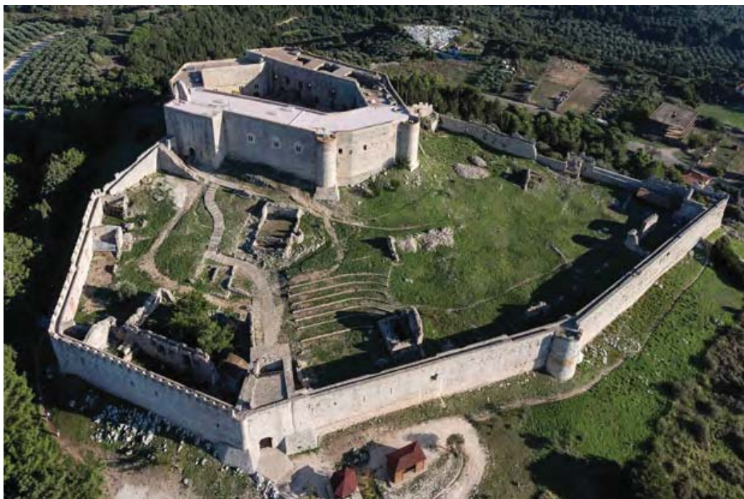
Εικ. 11: Κάστρο Χλεμούτσι μετά τις εργασίες στερέωσης, αποκατάστασης.

εκτέθηκαν σε προθήκη, συνοδευόμενα από σχετικό υπομνηματισμό. Με τον τρόπο αυτό προσφέρεται στον επισκέπτη η δυνατότητα να έλθει σε άμεση επαφή με την ιστορική συνέχεια του μνημείου και τα υλικά τεκμήρια χρήσης του σε προγενέστερες περιόδους.