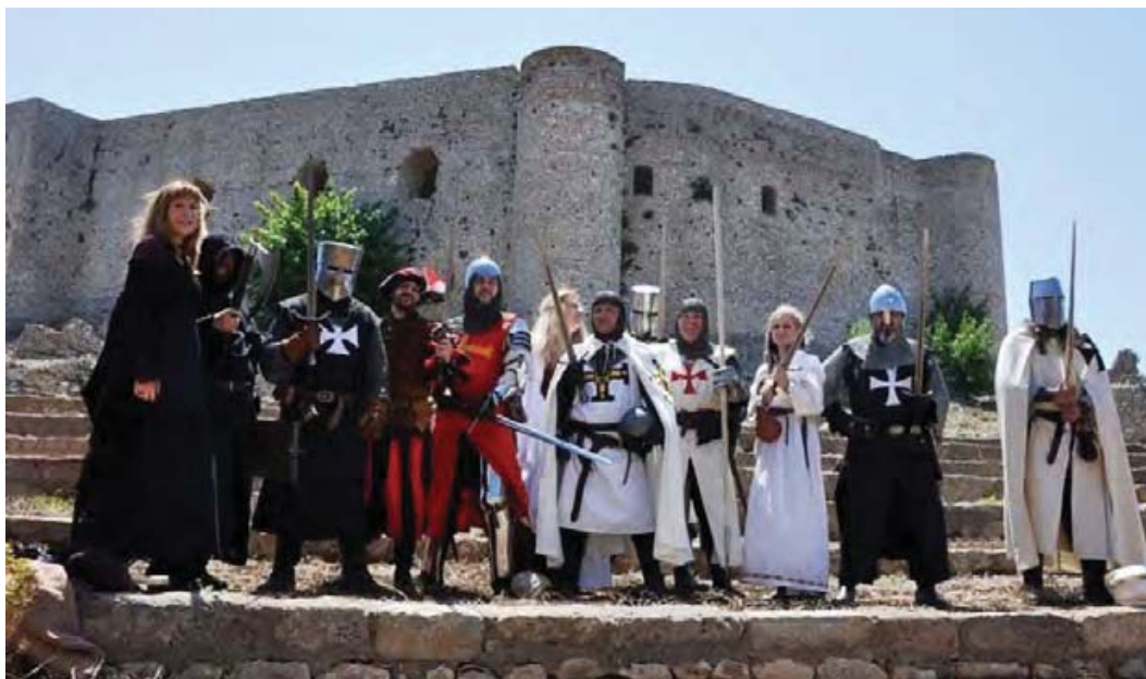
Εικ. 15: Κάστρο Χλεμούτσι. Μεσαιωνικά δρώμενα.