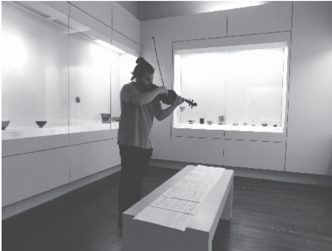
Εικ. 4. Στιγμιότυπο της δράσης «Επτ7α».

το ερωτηματολόγιο για την στατιστική έρευνα.