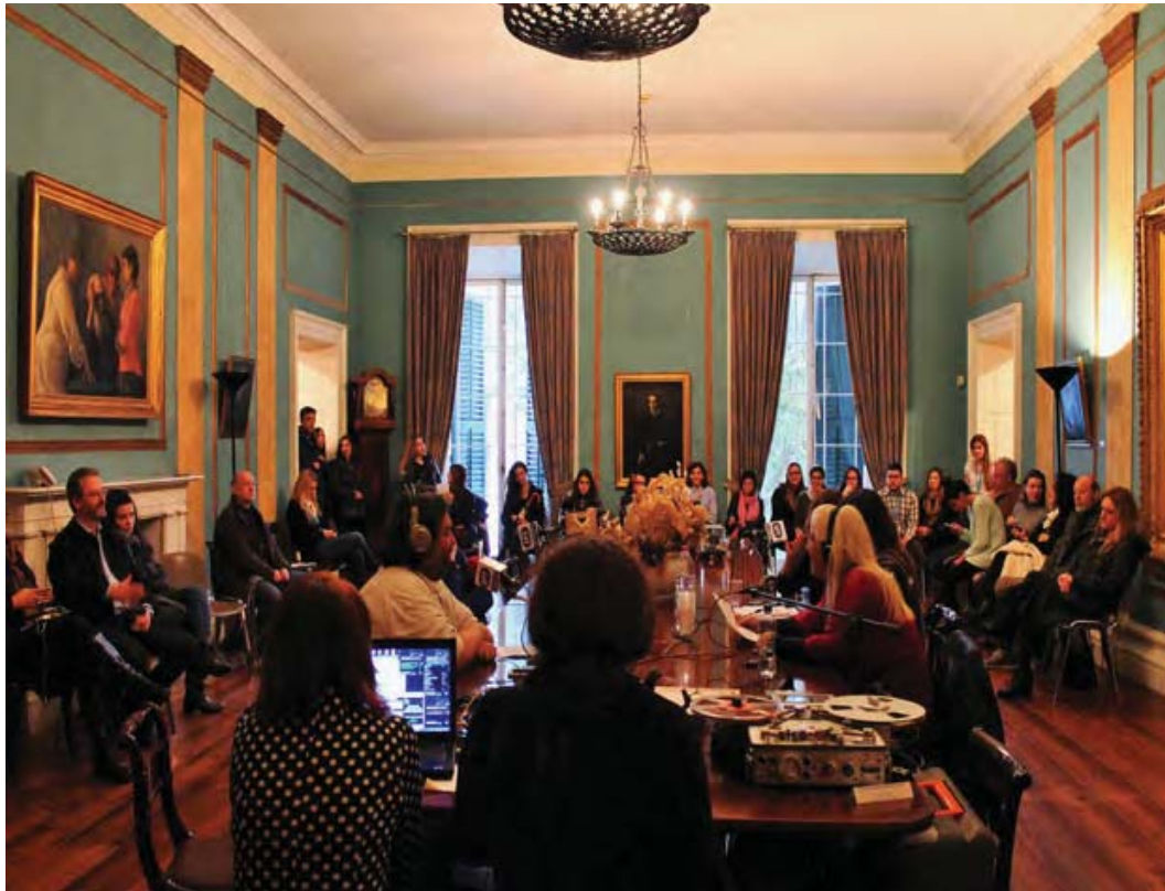
Εικ. 1. Στιγμιότυπο από την δράση στο πλαίσιο της Παγκόσμιας Ημέρας Ραδιοφώνου στους χώρους της Πινακοθήκης του Δήμου Κεντρικής Κέρκυρας.

κυρίως των φοιτητών, με τους φορείς της τοπικής πολιτιστικής παραγωγής και κατ' επέκταση την κοινωνία (Anila 2017; Κουρή 2016). Η Ομάδα, με εφόδιο την θεωρητική κατάρτιση από τα μαθήματα μουσειολογίας, δραστηριοποιήθηκε με αφορμή τον εορτασμό της Διεθνούς Ημέρας Μουσείων το 2015, οργανώνοντας και συντονίζοντας για πρώτη φορά στην Κέρκυρα ποικίλες εκδηλώσεις στις οποίες συμμετείχαν τέσσερα τοπικά μουσεία. Η ανταπόκριση του κοινού ήταν ενθαρρυντική, γεγονός που έδωσε την ώθηση στην Ομάδα να συνεχίσει το έργο της για τα επόμενα χρόνια. Πάντα σε συνεργασία με μουσειακούς φορείς του νησιού, συλλογικότητες και τα υπόλοιπα τμήματα του Ιονίου Πανεπιστημίου διαμορφωνόταν ένα ετήσιο πρόγραμμα παρεμβάσεων στην πολιτιστική πραγματικότητα της Κέρκυρας, με την προσοχή πάντα στραμμένη στον επισκέπτη και τις ανάγκες του. Σχεδιάστηκαν πολλές δράσεις με διαφορετικά περιεχόμενα προκειμένου να επιτευχθεί, αφενός η προσέλκυση νέου κοινού στα μουσεία και να «τολμήσουν», αφετέρου, τα μουσεία της Κέρκυρας να θίξουν ειδικά ζητήματα. Ενδεικτικά το 2016 υλοποιήθηκαν δράσεις με αφορμή τον εορτασμό της Παγκόσμιας Ημέρας Θεάτρου (συνεργασία με την Πινακοθήκη του Δήμου), την Παγκόσμια Ημέρα Ποίησης (συνεργασία με το Μουσείο Σολωμού; εικ. 1), τη Δημόσια