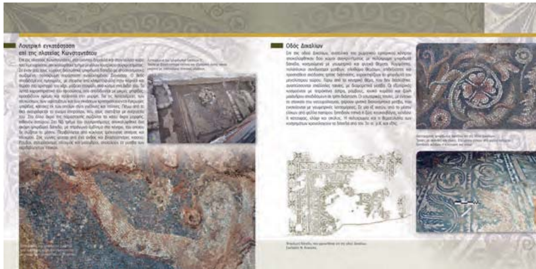
Εικ. 13. Αύλειος χώρος Αρχαιολογικής Συλλογής Σάμης. Ψηφιδωτά δάπεδα. Λουτρική εγκατάσταση επί της πλατείας Κωνσταντάτου στη Σάμη (λεπτομέρεια από τον οδηγό της Συλλογής 52-53).

Έως το τέλος του 2015 είχαν ολοκληρωθεί οι κτηριακές εγκαταστάσεις και η διαμόρφωση του περιβάλλοντος χώρου. Έκτοτε και μέχρι τις αρχές του 2018 19 πραγματοποιήθηκε αρχαιολογική και φωτογραφική τεκμηρίωση των προς έκθεση αντικειμένων, σχεδιασμός και επιμέλεια του εποπτικού υλικού και η δημιουργία οδηγού (Βικάτου & Ανδρεάτου 2020) (εικ. 14) και ενημερωτικού φυλλαδίου σε ψηφιακή μορφή που θα διατίθενται εκτυπωμένα στους επισκέπτες. Από το προσωπικό που έχει προσληφθεί για τις ανάγκες του έργου, συνεχίζεται το έργο της τεκμηρίωσης των εκθεμάτων με τη σχεδιαστική και ψηφιακή αποτύπωσή τους και ετοιμάζεται το υλικό που θα περιληφθεί στις πολυμεσικές εφαρμογές (διαδραστικές οθόνες αφής), καθώς και η δημιουργία εκπαιδευτικών δράσεων. Επιπλέον, στη συλλογή έχει προβλεφθεί για άτομα με προβλήματα όρασης η δημιουργία αντιγράφων αγγείων, απτικών επιφανειών και φυλλαδίου με πληροφορίες για τον εκθεσιακό χώρο και τα εκθέματα. Παράλληλα, συνεχίζεται η συντήρηση των ευρημάτων και έχουν ξεκινήσει οι διαδικασίες για την προμήθεια του εξοπλισμού των εσωτερικών χώρων της Συλλογής, με την προετοιμασία τεύχους για τη διενέργεια διεθνούς διαγωνισμού, αλλά και των προμηθειών για την ολοκλήρωση της διαμόρφωσης του περιβάλλοντος χώρου