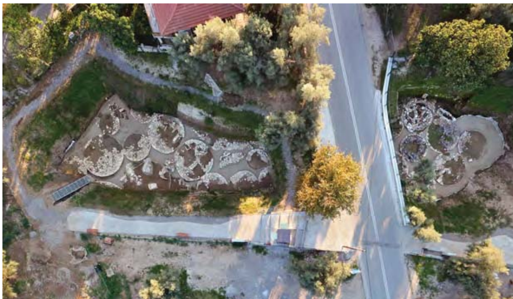
Ειχ. 5. Νυδρί Λευκάδας. Αεροφωτογραφία των τύμβων μετά την υλοποίηση του έργου ανάδειξης.