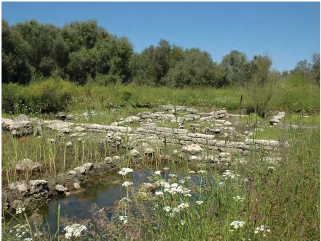
Εικ. 1α. Λευκάδα. Οι οικίες πριν τις εργασίες ανάδειξης.

Από την οικία I αποκαλύφθηκαν επτά χώροι. Η είσοδος, από την πλευρά του δρόμου, οδηγούσε σε ευρύχωρη αυλή με πηγάδι, στην ανατολική και νότια πλευρά της οποίας διατάσσονται μεγάλος ορθογώνιος χώρος (ο οίκος ή ο ανδρώνας) και μικρότεροι αποθηκευτικοί χώροι. Από την οικία II έχει ανασκαφεί η εσωτερική αυλή (αίθριο), γύρω από την οποία οργανώνονται οι υπόλοιποι χώροι. Ένας από αυτούς έχει ταυτιστεί με τον ανδρώνα και οι υπόλοιποι με δωμάτια καθημερινής διαβίωσης. Νότια των οικιών αποκαλύφθηκαν αποσπασματικά δύο ακόμη κτήρια. Η ανεύρεση αντικειμένων καθημερινής οικοσκευής (πήλινα αγγεία, μυλόλιθοι, χάλκινα αγκίστρια, μολύβδινα βαρίδια για δίχτυα, λίθινες άγκυρες), παρέχουν πολύτιμες πληροφορίες για την καθημερινή ζωή των ενοίκων και είναι δηλωτικά των ασχολιών τους με την καλλιέργεια δημητριακών και ελιάς και την αλιεία.