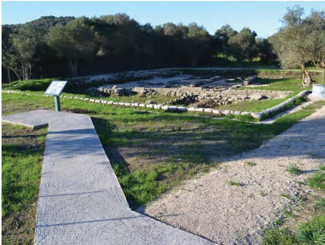
Εικ. 1β. Λευκάδα. Οι οικίες μετά τις εργασίες ανάδειξης.

της. Ήταν μονόριχτη με κιονοστοιχία στη μία μακριά πλευρά, ενώ ο προσανατολισμός της προς τη θάλασσα και η γειτνίασή της με το λιμάνι και τη μεγάλη λίθινη γέφυρα που ένωνε τη Λευκάδα με την περαιά της, υποδηλώνουν τον εμπορικό της χαρακτήρα.