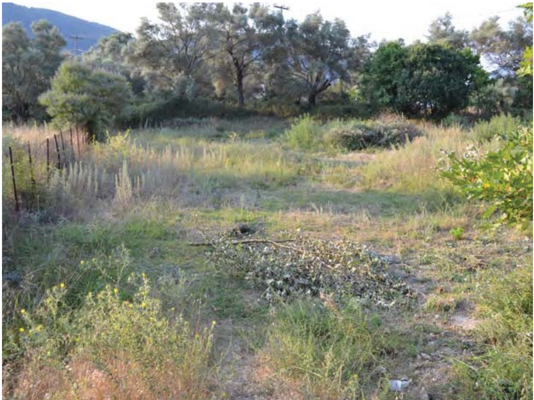
Εικ. 3. Νυδρί Λευκάδας. Νεκροταφείο τύμβων. Το ΒΔ οικόπεδο πριν τις εργασίες.

πρώιμη 3η χιλιετία, και όχι στην Υστερη Εποχή του Χαλκού (12ος αι. π.Χ.). Παρά τη χρονολογική αστοχία και τη διάψευση της θεωρίας του ότι οι τύμβοι φιλοξενούσαν τους ομηρικούς ήρωες, σε καμία περίπτωση δεν μπορεί να υποβαθμιστεί το έργο του W. Dörpfeld, που υπήρξε πρωτοπόρο ως προς την αρχαιολογική μεθοδολογία και τεκμηρίωση (Dörpfeld 1927).