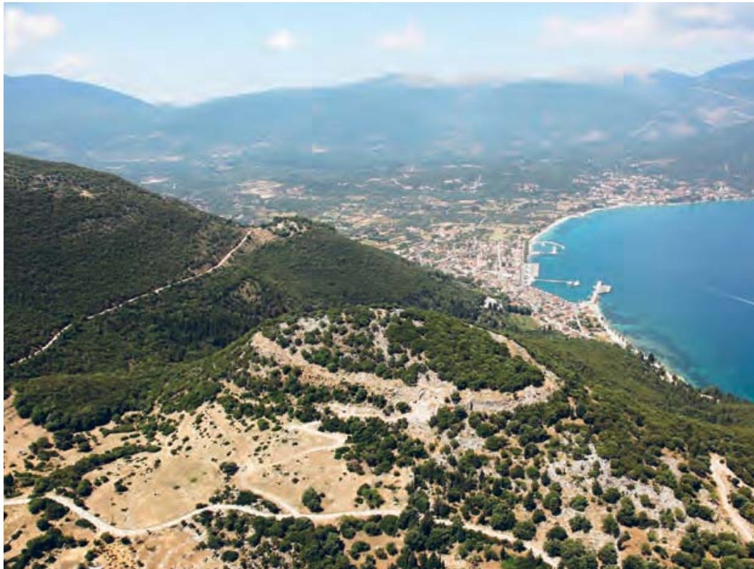
Εικ. 9. Η ακρόπολη της Σάμης από ΒΑ.

χρονοδιάγραμμα του έργου παρατείνεται έως τις 28 Φεβρουαρίου 2019.