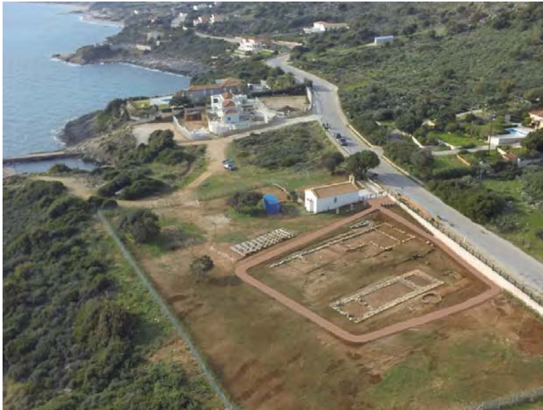
Εικ. 6β. Σκάλα Κεφαλονιάς. Γενική άποψη του ιερού (αρχαϊκός ναός, στωικό οικοδόμημα, τμήμα του περιβόλου) μετά την ολοκλήρωση των εργασιών ανάδειξης.

αντιμετωπισθούν προβλήματα ασφάλειας και συντήρησης του χώρου και να καταστεί επισκέψιμος και αναγνώσιμος στο κοινό, σε συνδυασμό με τα υπόλοιπα μνημεία της περιοχής (ρωμαϊκή έπαυλη Σκάλας, θολωτός μυκηναϊκός τάφος Τζαννάτων Πόρου).