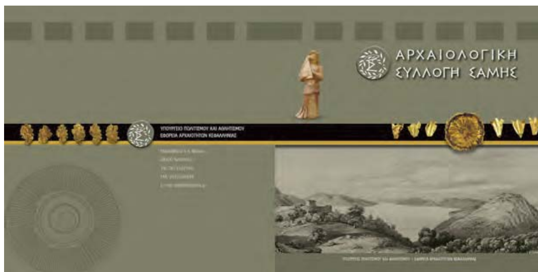
Εικ. 14. Ο οδηγός της Αρχαιολογικής Συλλογής Σάμης (Βικάτου & Ανδρεάτου 2020).

(προθήκες και λοιπές μουσειακές κατασκευές, στηρίξεις, εκτυπώσεις εποπτικού υλικού, ηλεκτροφωτισμός εσωτερικού και περιβάλλοντα χώρου, μεταλλικές κατασκευές και τοποθέτηση στεγάστρου).