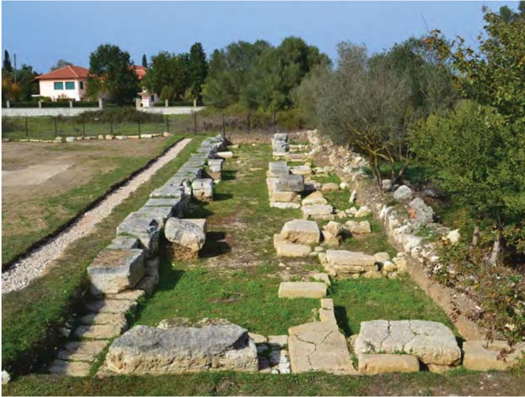
Εικ. 2β. Λευκάδα. Η στοά μετά τις εργασίες ανάδειξης.

περιόδου και οι τύμβοι του είναι οι πρωιμότεροι στον ελλαδικό χώρο. Πρόκειται για κυκλικές κατασκευές με επιμελημένο λίθινο περιμετρικό κρηπίδωμα από λίθινες πλάκες σε επάλληλες στρώσεις, η διάμετρος των οποίων κυμαίνεται από 2,70 μ. έως 9,60 μ. και το ύψος τους έφτανε στα 1,10-1,40 μ. Κάθε τύμβος περιελάμβανε έναν κύριο τάφο, που ανήκε σε ενήλικο άτομο, συνήθως άνδρα, και έως τρεις δευτερεύοντες τάφους, παιδιών κατά κύριο λόγο, που είχαν συγγενικούς δεσμούς με τον νεκρό της κεντρικής ταφής (Βικάτου 2014: 14-21; Vikiatou 2014: 14-21). Λόγω των πλούσιων κτερισμάτων που περιείχαν ορισμένοι, οι τύμβοι, θεωρήθηκαν από τον W. Dörpfeld βασιλικοί τάφοι και αποδόθηκαν στα επιφανή μέλη της κοινωνίας της ομηρικής Ιθάκης. Αναμφίβολα, τα πλούσια κτερίσματα φανερώνουν την ύπαρξη μιας ελίτ που δημιουργεί για τα μέλη της μια ξεχωριστή νεκρόπολη επιλέγοντας έναν ιδιαίτερο τύπο τάφου, η οποία αποτελεί την ανώτερη κοινωνικά ομάδα (τοπαρχία) σε μια πρωτοαστική κοινότητα, που την περίοδο αυτή ιδρύεται και ακμάζει στην εύφορη πεδιάδα του Νυδριού (Βικάτου 2014: 22-25). Αν και από την εποχή της έρευνας η θεωρία του δεν ήταν αποδεκτή, η επανεξέταση των κτερισμάτων σε σύγκριση με ευρήματα από άλλες περιοχές του Αιγαίου έδειξε ότι οι τύμβοι χρονολογούνται στην