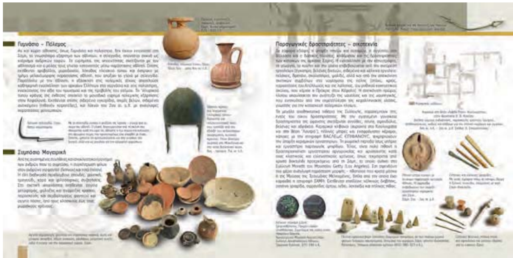
Εικ. 12. Αρχαιολογική Συλλογή Σάμης. Θεματική ενότητα 3. Γυμνάσιο - Πόλεμος, Συμπόσιο - Μαγειρική, Παραγωγικές δραστηριότητες - οικόπεδια (λεπτομέρεια από τον οδηγό της Συλλογής 34-35).

4. Ταφικά έθιμα. 17 Παράλληλα, προβλέπεται στον περιβάλλοντα χώρο του κτηρίου έκθεση ψηφιδωτών δαπέδων (εικ. 8, 13), προερχόμενων από κτήρια της Σάμης των ρωμαϊκών χρόνων, οπότε φαίνεται ότι η πόλη περνούσε μία νέα περίοδο ακμής (Σωτηρίου 2014, 1843-1845 και 1850-1861; Βικάτου-Ανδρεάτου 2020, 48-53). 18