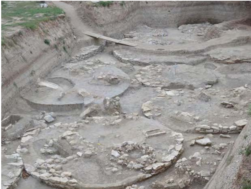
Εικ. 4. Νυδρί Λευκάδας. Νεκροταφείο τύμβων. Το ΒΔ οικόπεδο μετά την ολοκλήρωση του έργου ανάδειξης.

Στο ΝΑ οικόπεδο αποκαλύφθηκαν οι 11 από τους 22 τάφους. Στο πλαίσιο του έργου έγιναν εκτενείς αποψιλώσεις και καθαρισμοί, ενώ ιδιαίτερη έμφαση δόθηκε στην προσεκτική απομάκρυνση των νεώτερων επιχώσεων που κάλυπταν τους τύμβους. Μετά την αποκάλυψή τους πραγματοποιήθηκαν εργασίες συντήρησης και αποκατάστασης, με γνώμονα τη διατήρηση της αισθητικής των ίδιων των μνημείων, την ένταξή τους στο φυσικό περίγυρο, αλλά και τη διδακτικότητα του αρχαιολογικού χώρου (εικ. 5) (Βικάτου 2014: 28-33; Βικάτου 2014: 28-33; Βικάτου 2015α: 641-642). Ειδικότερα πραγματοποιήθηκαν: