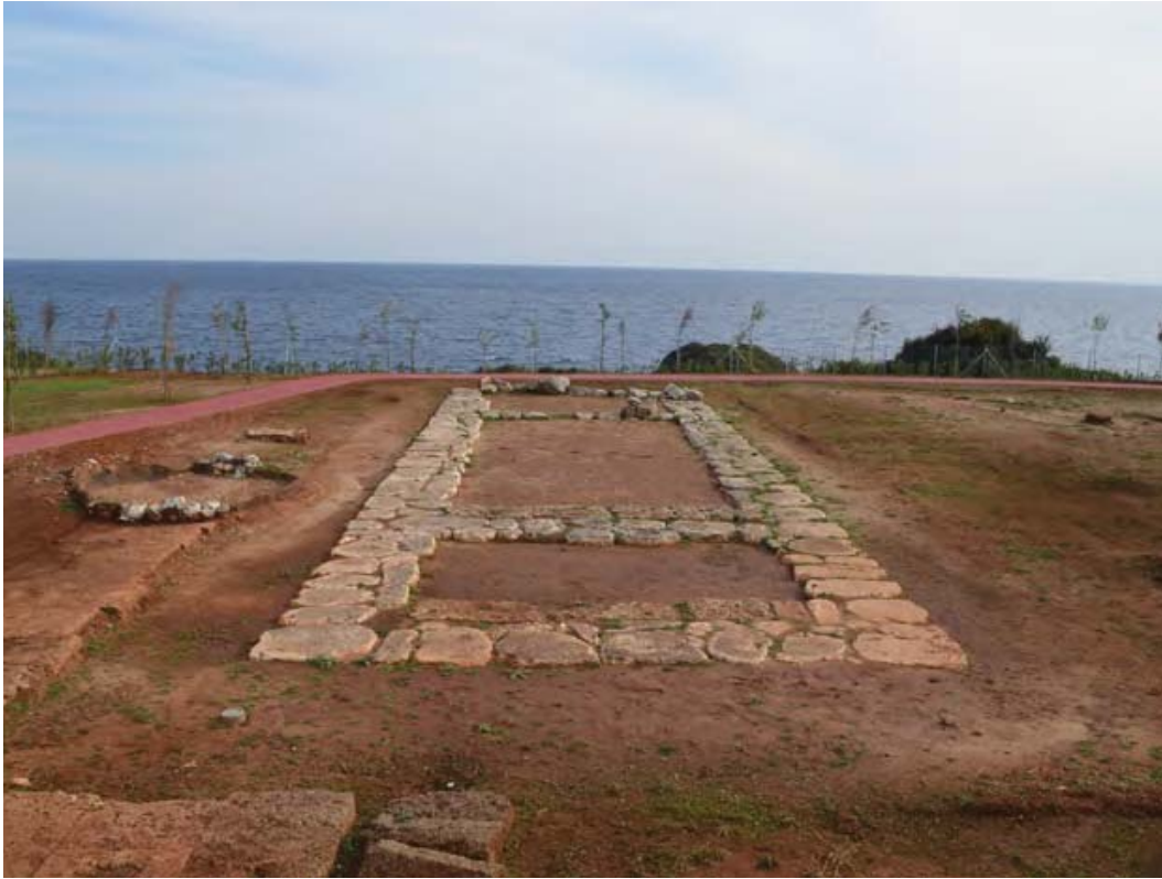
Εικ. 7β. Σκάλα Κεφαλονιάς. Γενική άποψη του αρχαϊκού ναού μετά την ολοκλήρωση των εργασιών ανάδειξης.